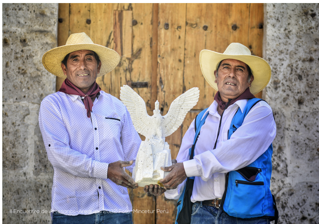
II Encuentro de Artesanos-Arequipa 2022.

Dichos proyectos se encuentran en diferentes estados de gestión, tales como: en ideas de proyectos, en formulación, declarados viables, aprobados y en ejecución. Algunos de ellos se incluyen en los programas de inversión multianuales del Gobierno Regional de Arequipa, del Ministerio de Comercio Exterior y Turismo, así como en los programas de las municipalidades provinciales y distritales del ámbito de la región.