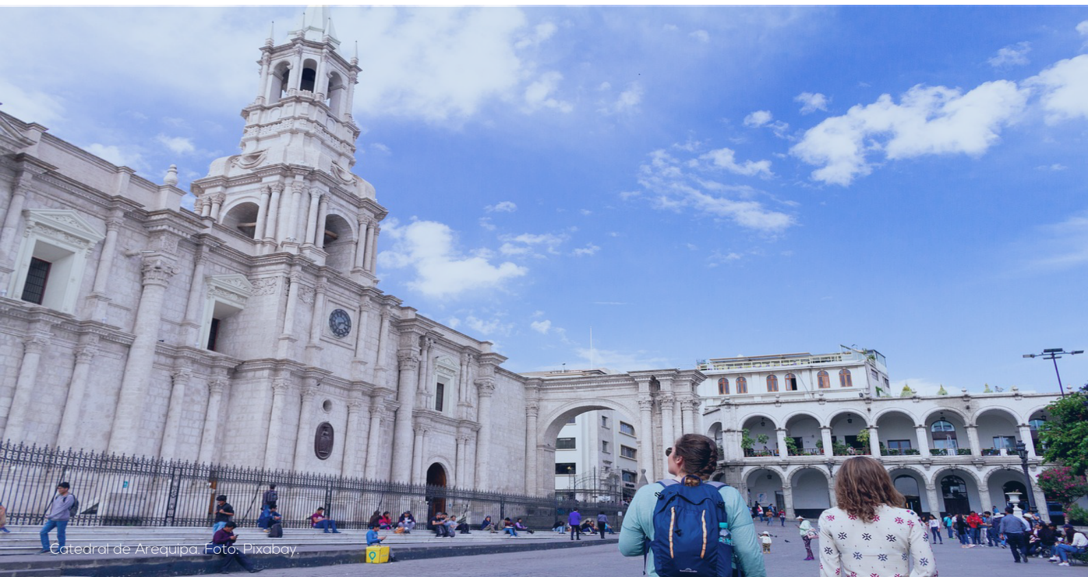
Catedral de Arequipa.